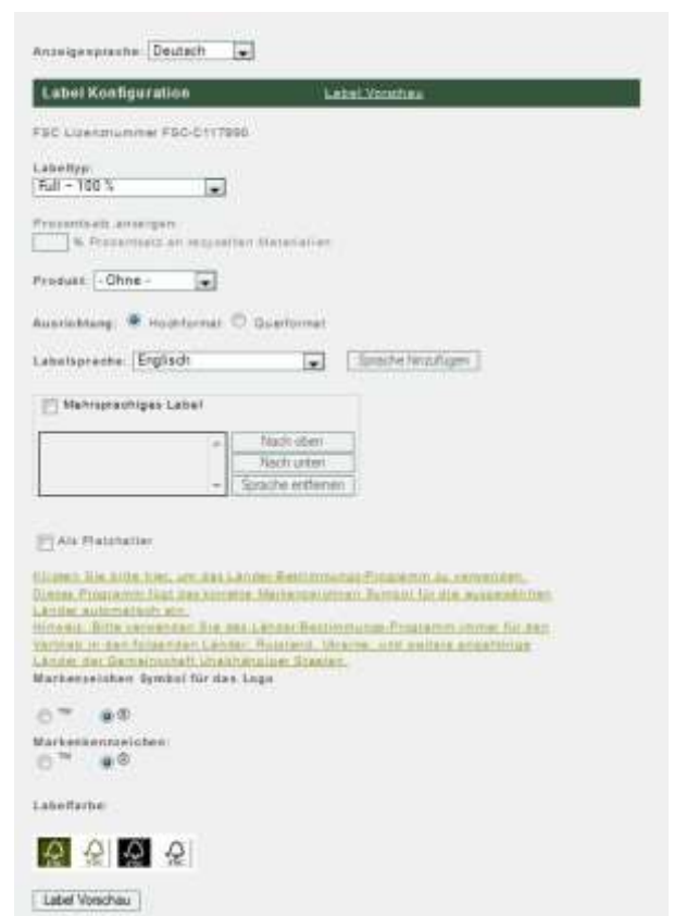
Abbildung 4: Eingabemaske für die Erstellung von on-product-Labeln

Anmerkung: Falls Sie Probleme mit dem FSC Trademark-Portal oder dem FSC Label-Generator haben, kontaktieren Sie bitte Ihren Zertifizierer.