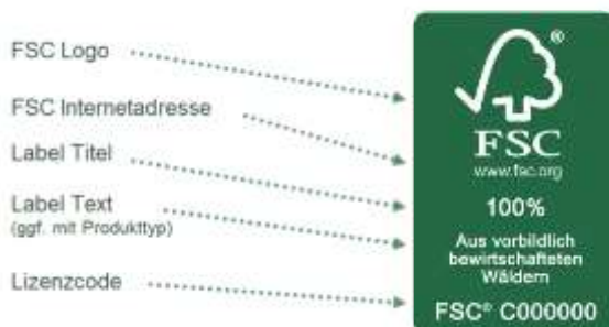
Abbildung 2 : Das FSC-Label und seine Bestandteile

Das FSC-Werbefeld wird für Werbe- und Kommunikationszwecke verwendet, ohne dass ein bestimmtes Produkt gekennzeichnet wird (sog. „off-product-Verwendung“). Zum Beispiel wenn auf die Zertifizierung des Betriebes hingewiesen wird. Die einzelnen Bestandteile des FSC-Werbefeldes können Sie Abbildung 3 entnehmen.