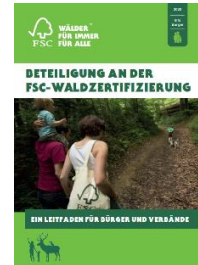
Broschüre „Beteiligung an der FSC-Waldzertifizierung“

Die neue Stakeholderbroschüre erläutert die Bürgerbeteiligung im Rahmen der FSC-Zertifizierung. DIN A4, farbig, 26 Seiten