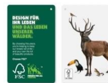
Hang-Tags mit Lizenznummer

Zum Anbringen an FSC- zertifizierten Produkten – auch als Produktlabel verwendbar. 90x120mm, ab 200 Stk.