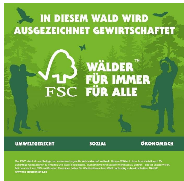
Waldschild für FSC-zertifizierte Forstbetriebe

Als Hinweis auf die FSC-Zertifizierung z.B. am Waldeingang. Wetterfeste Holzwerkstoffplatte (FSC-gekennzeichnet) oder Alu-Dibond, 400x400mm Auf Wunsch mit Eindruck Ihres Logos.