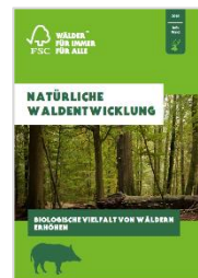
Themenpapier „Natürliche Waldentwicklung“

Die Unterschiede in der Waldbewirtschaftung nach FSC. Ansprechend gestaltet und kurz und bündig formuliert. DIN A4, 4 Seiten