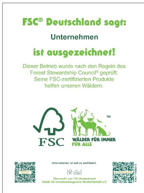
Unternehmensschild „Dieser Betrieb ist ausgezeichnet“

Wetterfeste Holzwerkstoffplatte, mit Befestigungsmaterial und Bohrlöchern 300x420mm