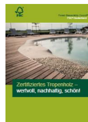
Flyer „Zertifiziertes Tropenholz – wertvoll, nachhaltig, schön!“

Darstellung der Eigenschaften von Tropenholz sowie der Zertifizierung in Tropenwäldern. DIN A4, 4 Seiten