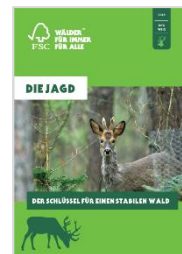
Themenpapier „Die Jagd“

Die Unterschiede in der Waldbewirtschaftung nach FSC. Ansprechend gestaltet und kurz und bündig formuliert. DIN A4, 4 Seiten