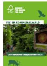
Flyer „FSC im Kommunalwald“

FSC-Zertifizierung im Kommunalwald. Vorteile für Bürger und Waldbesitzer, kurz und prägnant. DIN A5, 4 Seiten