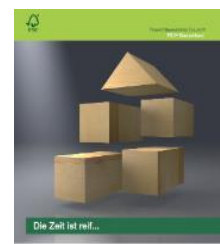
Broschüre für Architekten „Die Zeit ist reif...“